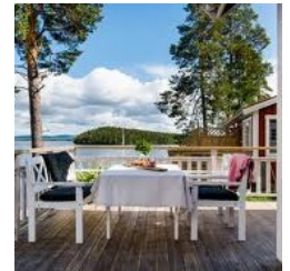
Den rätta miljön för avkoppling och rekreation