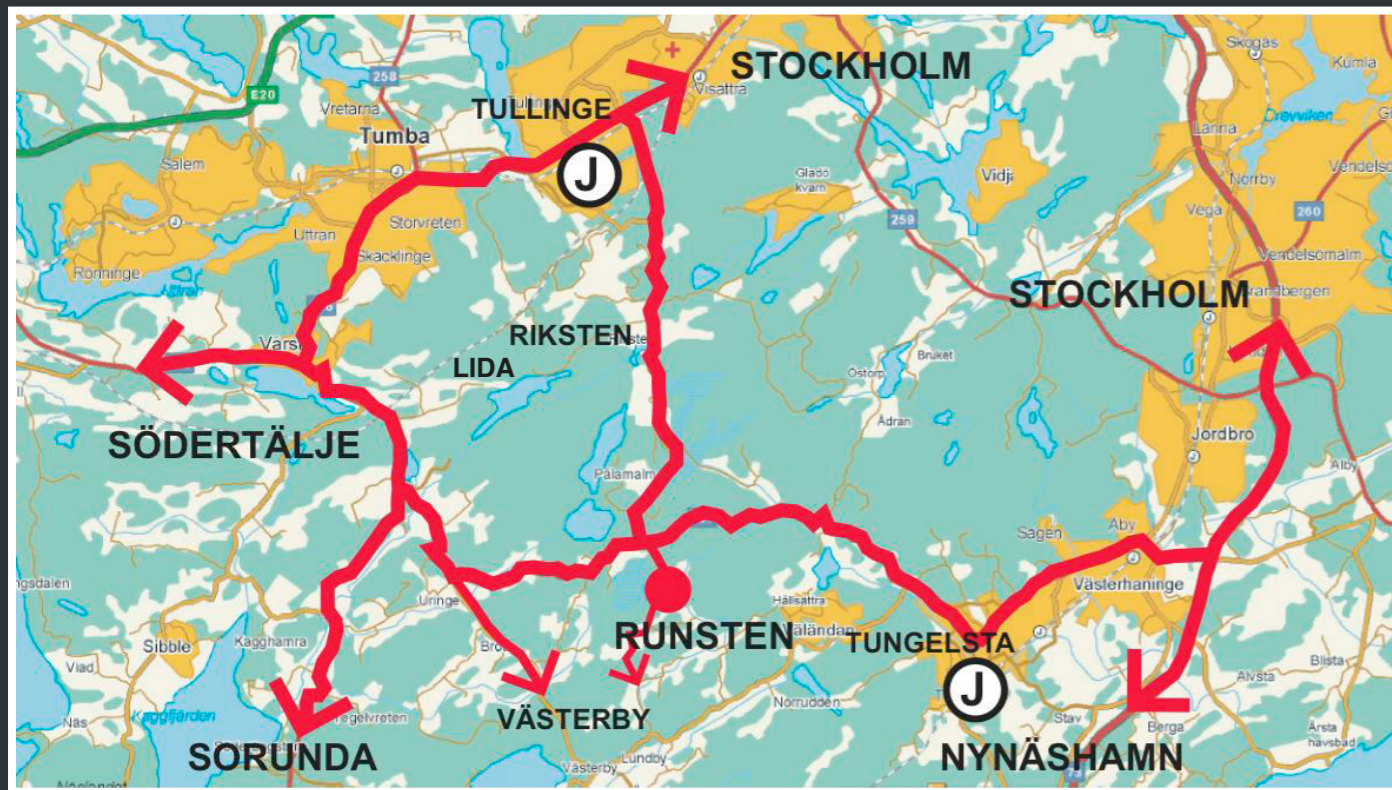
I det dynamiska Stockholmsområdet byggs och utvecklas det för fullt. Kartan ritas om och nya bostadsområden etableras.